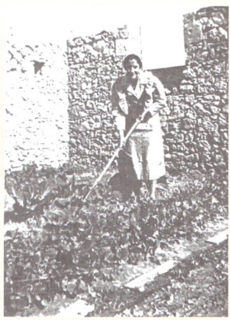
בחצר הבית ברח' רמב"ם (1954)