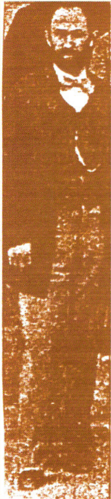
דוד גולד, אוקטובר 1980, ירושלים

© 2002. כל הזכויות שמורות לגרשון נראל. אין להעתיק מאמר זה או חלקים ממנו ללא רשות בכתב מהמחבר