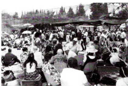
כנס שבועות ביד השמונה

גוף המשיח בארץ גדל ומתפתח ואנו מודים לאדון על כל הזדמנות שיש לנו לחגוג ביחד, להלל את האדון ולהיות אחד בו. ברצוננו גם להודות לאנשי מושב יד השמונה שפתחו את ביתם עבורינו, לחן שתרם שעות רבות מזמנו החופשי בעזרה בסידור המקום, לצ'רלי ולרבקה קריסטי ולקבוצת YWAM שהיו נכונים לכל עבודה ומשימה.