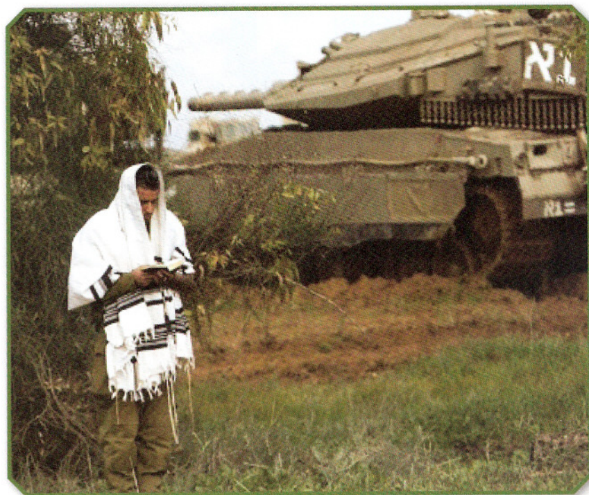
חייל על גבול רצועת עזה

תפילתנו היא שבעזרת אבינו שבשמים ואדונינו ישוע המשיח נוכל להבין את האירועים הצבאיים והמדיניים המתרחשים סביבנו בימים מיוחדים אלה של